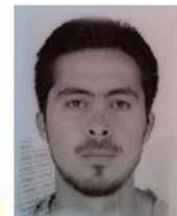
Blanco y negro