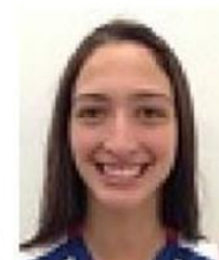
Fotografía de baja calidad