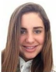
Cabello que cubre parte del rostro