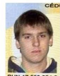
Fotografía de documentos