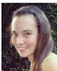
Fondo no blanco y foto de perfil