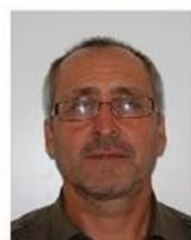
Reflejo en anteojos