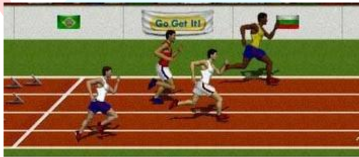
Carrera de 30 metros